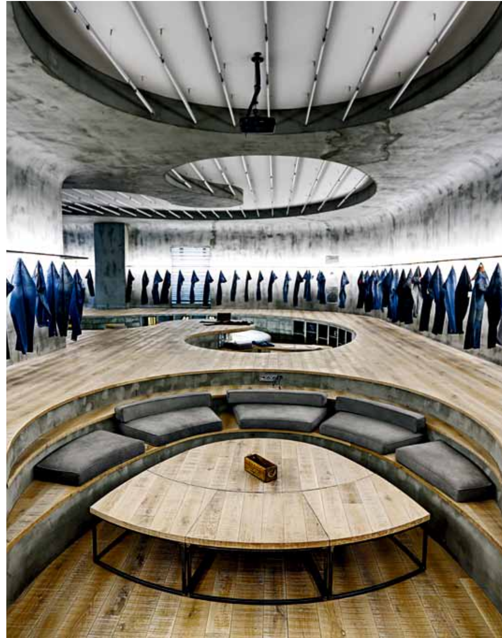
在高低不平的平台中，呈弧形状的工作台实用性和美观性兼得，在灯光的映衬下，显得宁静而平和。

In this space, there was no conventional furniture accessories, but derived from the space can support flexible behavior, resulting in a variety of interactive spaces. Neutral color space, in addition to the introduction of artificial lighting also has natural light outside the window, a rich visual experience. In addition, it is formed between the concrete walls and wooden floors complement each other well, plus the top of the full sense of the rich industrial fluorescent lights, as a whole to create a strong visual impact.