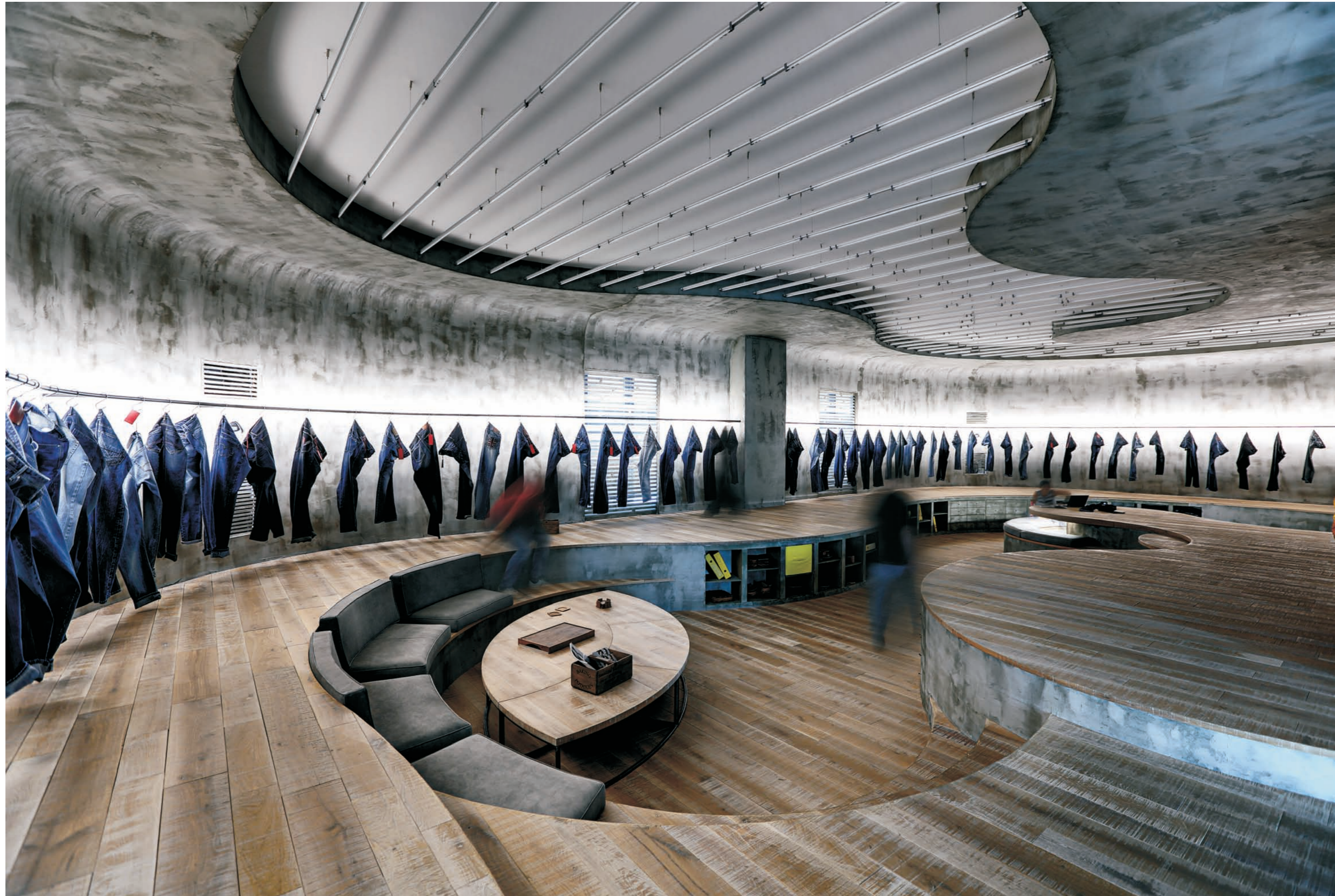
图1 设计师以曲线划分出不同高度差的平台与围合区域，创建了一个具有层次且无行为限制的空间